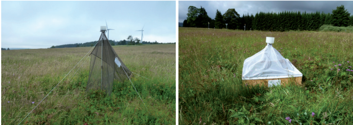
Abb. 1 und 2: Malaisefalle (links) und Biozönometer (rechts) auf Fläche Nr. 5. - Fig. 1 and 2: Malaise trap (left) and biocoenometer (right) on site no. 5 (Photos: ©: L. SCHLOSSER).