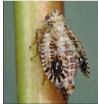
Abb. 2: Der Nachweis von Trypetimorpha occidentalis aus Podersdorf stellt den ersten Nachweis für das Burgenland dar. (Foto: W. Holzinger). – Fig. 2: The record of Trypetimorpha occidentalis in Podersdorf is the first from Burgenland. (Photo: W. Holzinger).