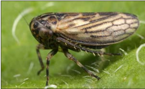
Abb. 1: Anaceratagallia ribauti ist die häufigste Art im Randbereich der Lacken. – Fig. 1: Anaceratagallia ribauti ist the most common leafhopper of the border areas of the salt lakes.

Errastunus ocellaris (FALLÉN, 1806) : E -B1 (Falle 2), 20. 5. 2001: 1 M 1 Lv.; E -B1 (Falle 3), 3. 6. 2001: 1 W; E -U1 (Falle 2), 18. 6. 2001: 1 M 1 W; E -U3 (Falle 2), 20. 10. 2001: 1 W; E -U3 (Falle 4), 5. 8. 2001: 2 Lv.; E -U3 (Falle 5), 19. 8. 2001: 1 M; E -U3 (Falle 5), 6. 9. 2001: 1 M 1 W; P -U1 (Falle 2), 20. 5. 2001: 1 M 1 Lv.; ZS-U2 (Falle 1), 20. 5. 2001: 1 W 1 Lv.; ZS-U2 (Falle 1), 23. 8. 2001: 1 M; ZS-U2 (Falle 1), 4. 5. 2001: 1 Lv.; ZS-U2 (Falle 2), 4. 5. 2001: 1 Lv.; ZS-U2 (Falle 2), 7. 9. 2001: 1 W 3 Lv.; ZS-U2 (Falle 3), 20. 10. 2001: 1 W; ZS-U2 (Falle 3), 5. 8. 2001: 1 Lv.